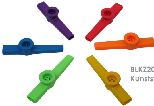
BLKZ202 Kunststoff color